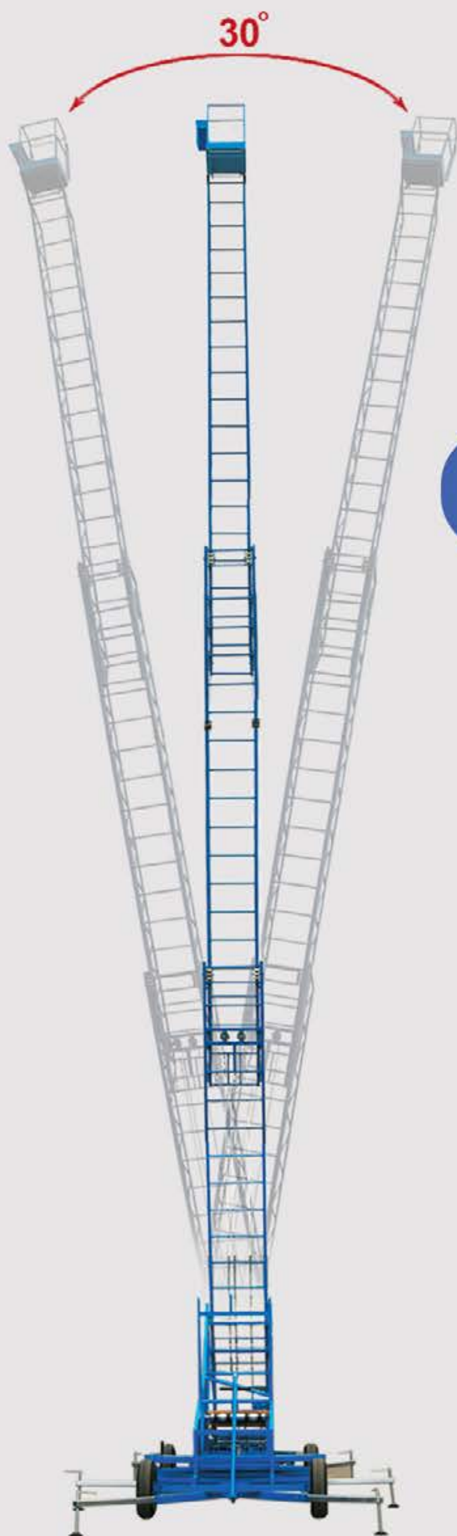
مدل : DMLPR