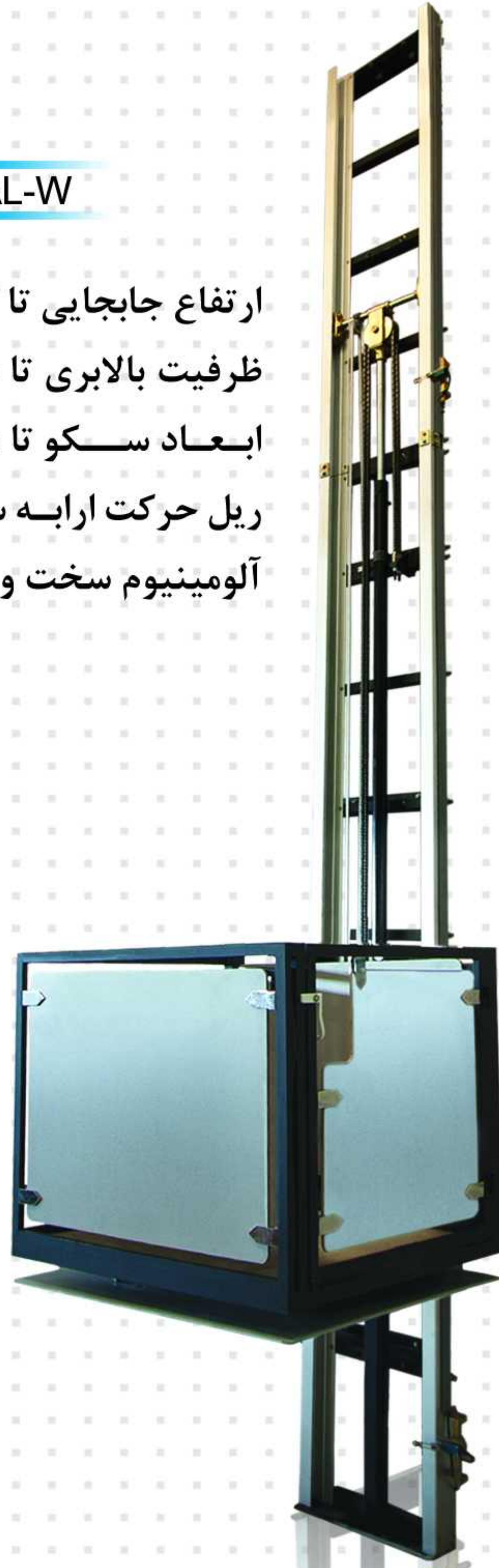
Model : HSL2-ST-W T9

ارتفاع جابجایی تا ۱۲ متر ظرفیت بالابری تا ۷۰۰ کیلوگرم ابعاد سکو تا ۱/۵ × ۱ متر ریل حرکت ارابه سکو از نوع پروفیل آلومینیوم سخت و آنادایز شده