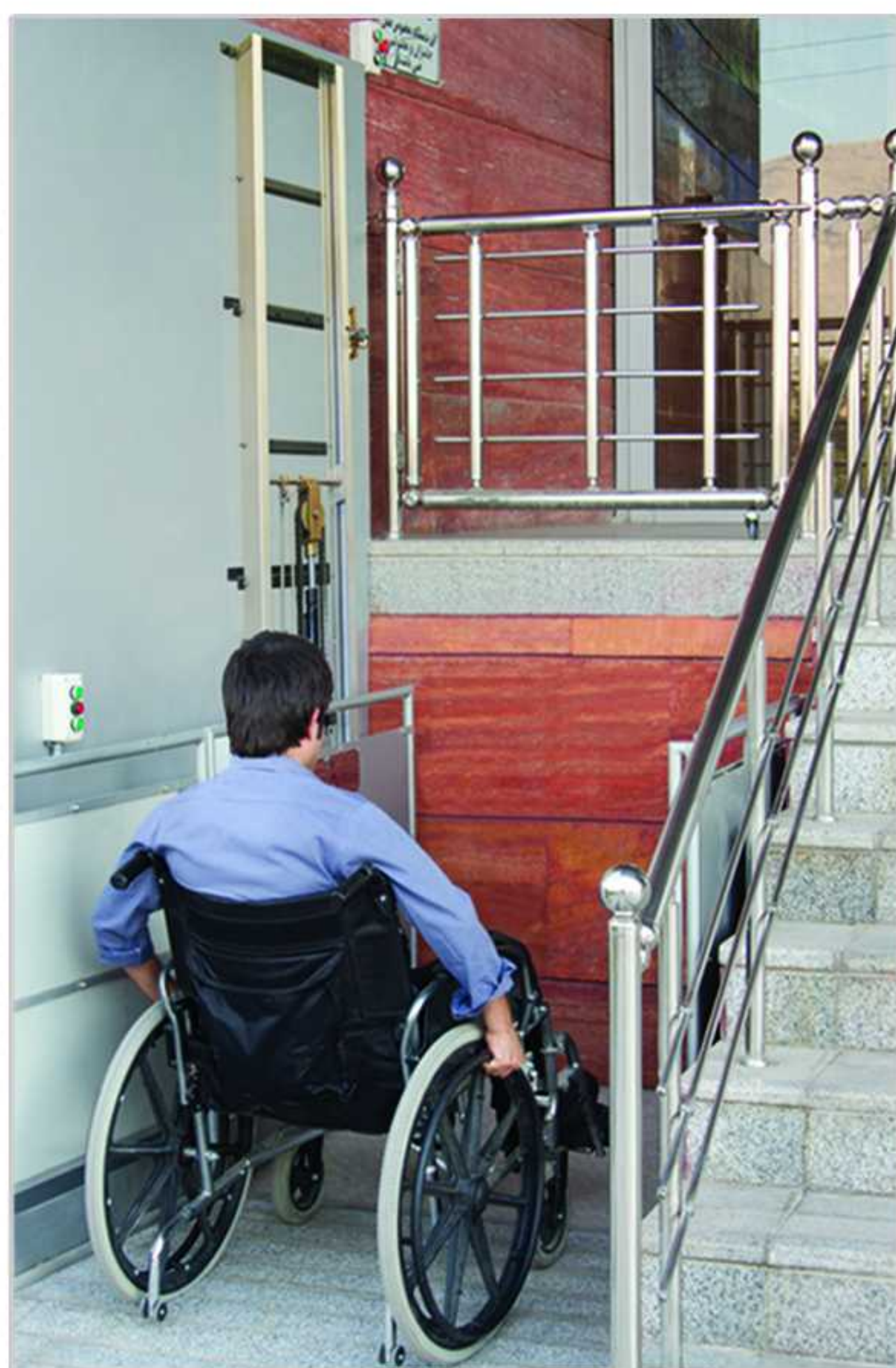
بالابر ثابت ویژه حمل ویلچر