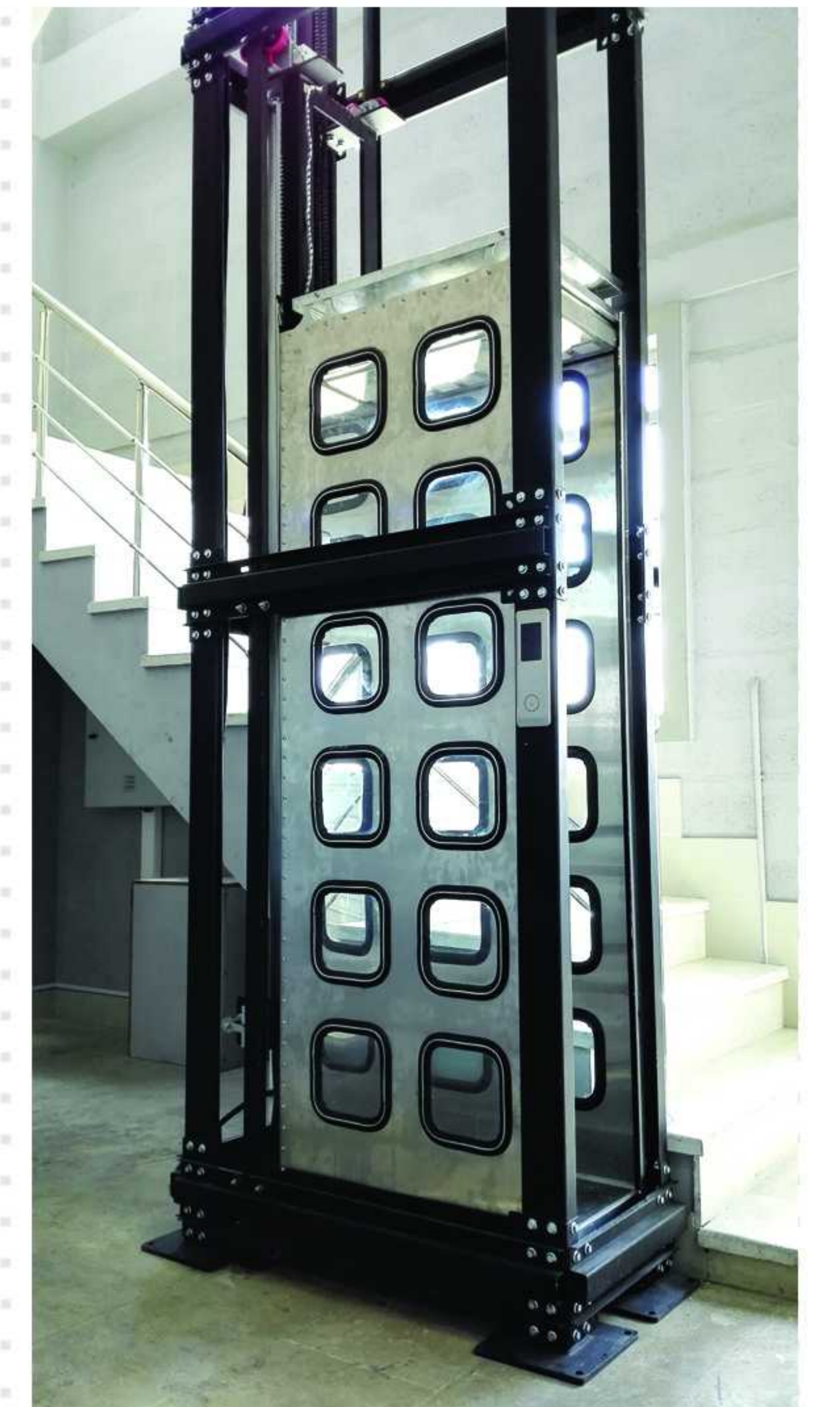
امکان نصب در فضایی محدود و میان پاگرد پلکان حتی با عرض ۵۰ سانتیمتر بدون نیاز به چاله و تخریب