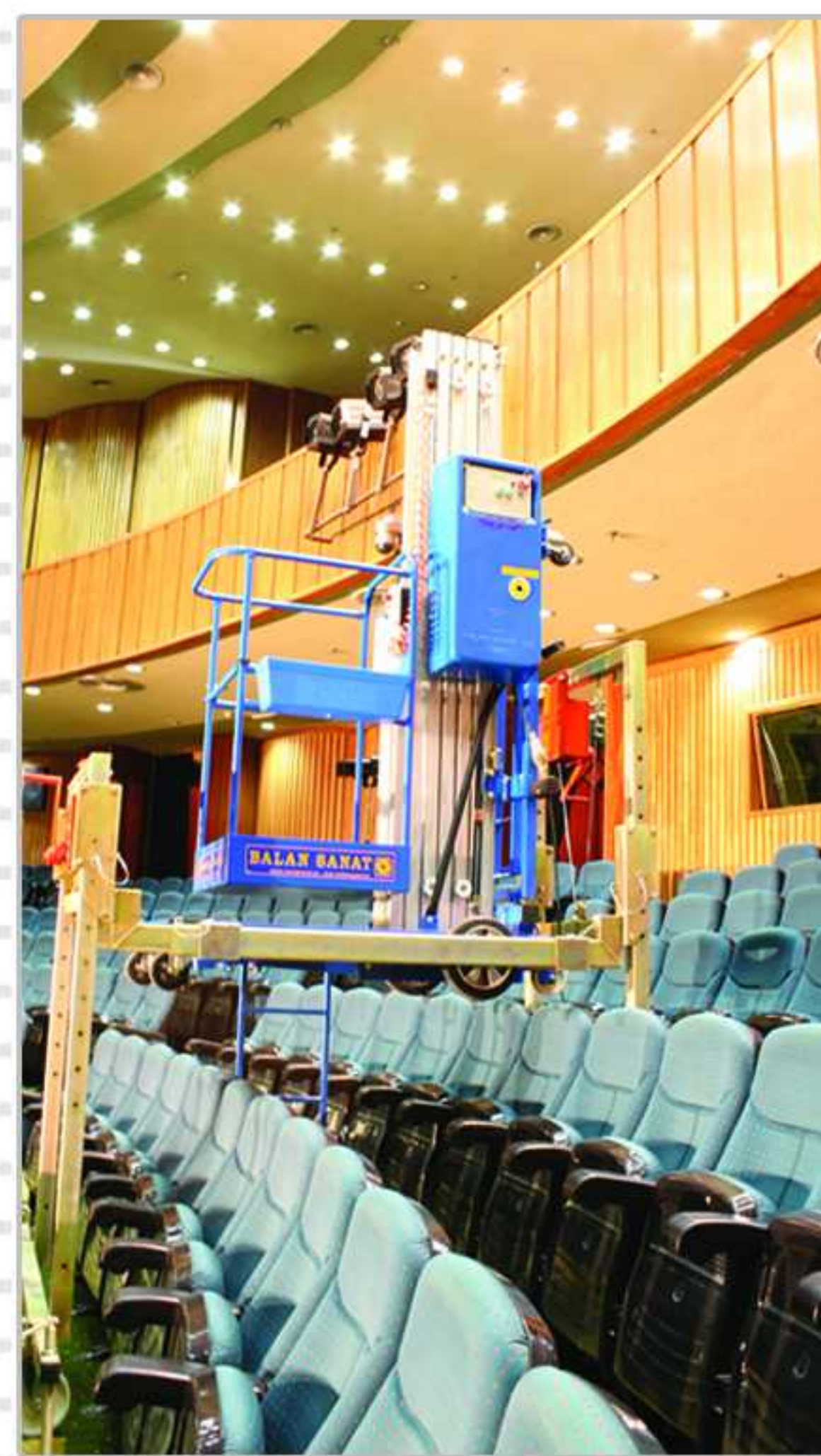
Model : EHS - SL