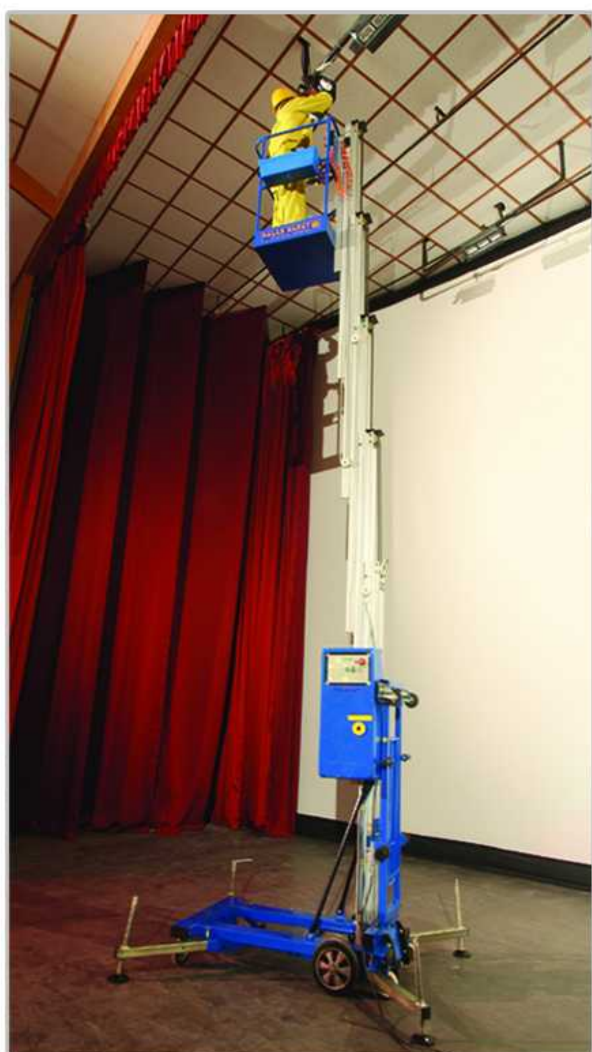
Model : EHS